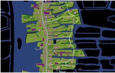
[3] Een schematische weergave van de natuurlijke groei in lintdorpen