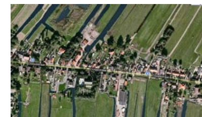
[1][2] De dorpen Staphorst en Jisp